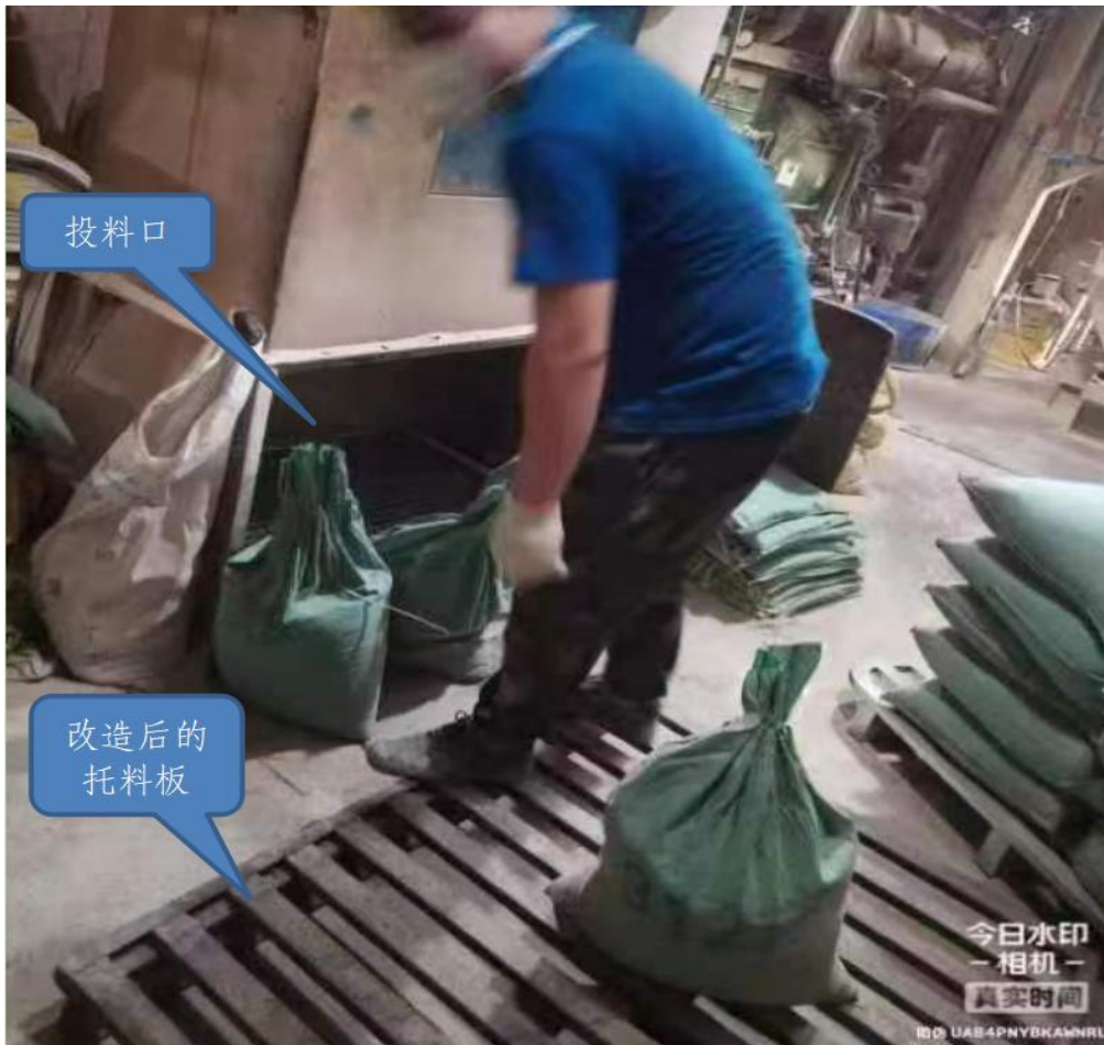
图 2 事发时托料板与投料口间的相对位置