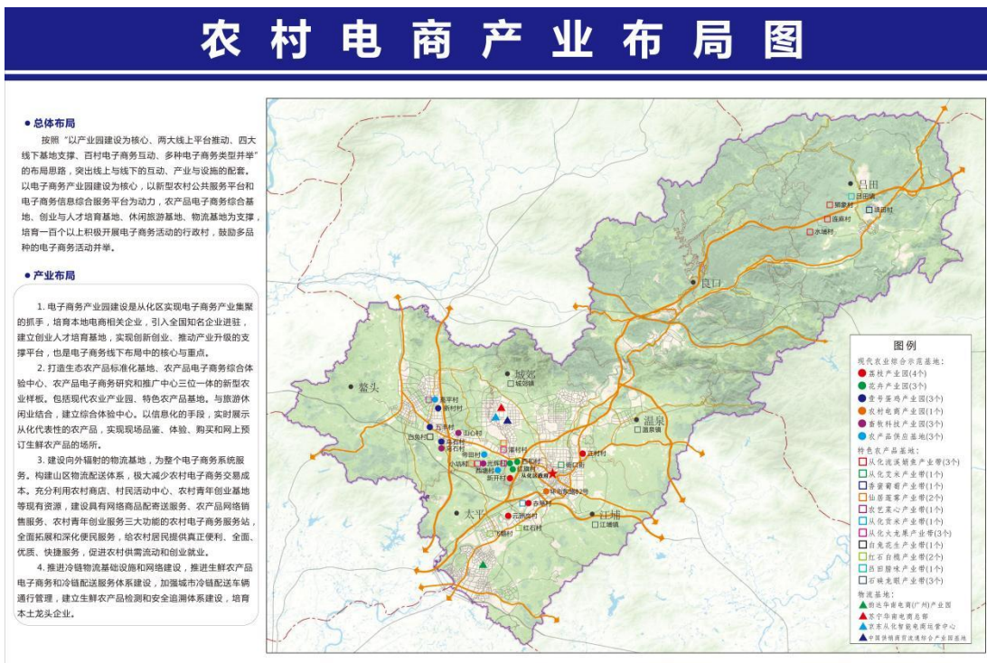
图 4-1 农村电商产业布局图

按照“以产业园建设为核心、两大线上平台推动、四大线下基地支撑、百村电子商务互动、多种电子商务类型并举”的布局思路，突出线上与线下的互动、产业与设施的配套。以电子商务产业园建设为核心，以新型农村公共服务平台和电子商务信息综合服务平台为动力，农产品电子商务综合基地、创业与人才培育基地、休闲旅游基地、物流基地为支撑，培育100个以上积极开展电子商务活动的行政村，鼓励多品种的电子商务活动并举。