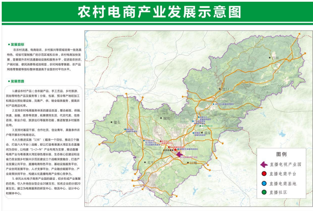
图 3-1 农村电商产业发展示意图