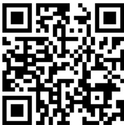
《科技企业投融资需求表》二维码

（1）科技金融精准服务。自 2020 年起，市科技局将精准收集拟申请入库科技型中小企业融资需求（股权、债权），并通过广州市科技型中小企业信贷风险补偿资金池（单个企业最高可申请贷款 2000 万元，操作指引详见附件 3）、广州市科技成果产业化引导基金为入库企业提供科技金融精准对接服务。拟申请入库科技型中小企业可通过微信扫描二维码或登录链接地址 https://www.wenjuan.com/s/ZneeAzI/ 填写并提交《科技企业投融资需求表》（详见附件 4）。